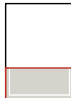
1/3 Seite quer